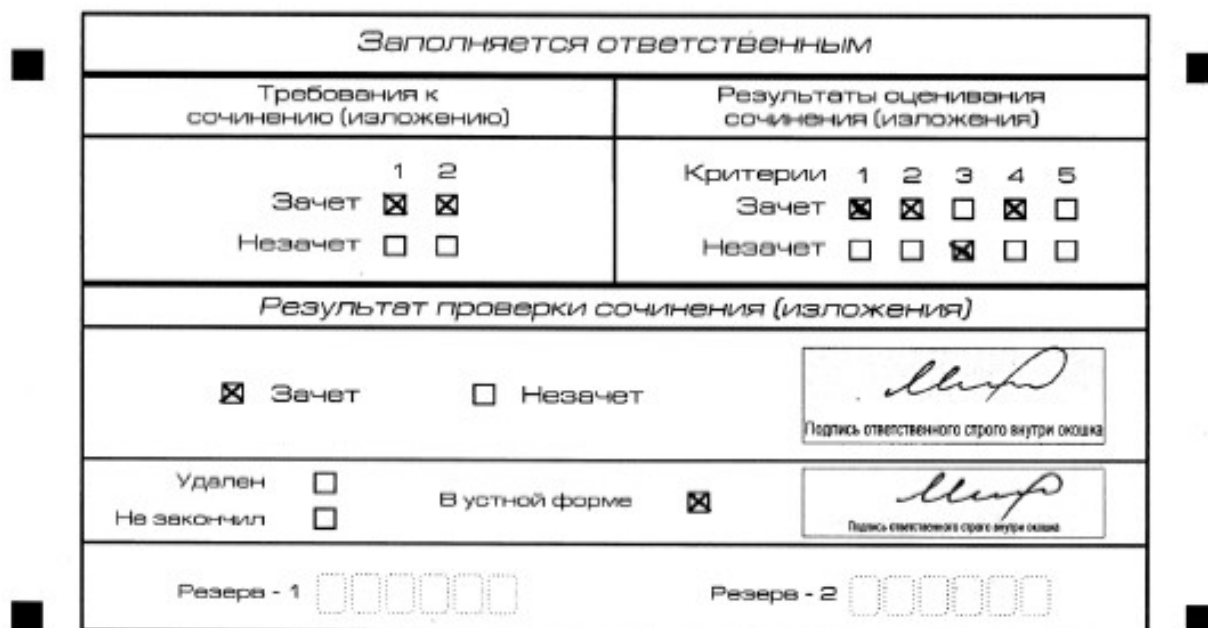
Рис. 11. Область для оценки работы сочинения (изложения) в устной форме

После окончания заполнения бланка регистрации ответственное лицо ставит свою подпись в специально отведенном для этого поле.