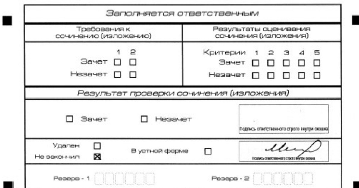
Рис. 12. Заполнение полей нижней части бланка регистрации (завершение написания сочинения (изложения) по уважительным причинам)

В случае если участник итогового сочинения (изложения) по состоянию здоровья или другим объективным причинам не может завершить написание итогового сочинения (изложения), он может покинуть место проведения итогового сочинения (изложения). Члены комиссии по проведению итогового сочинения (изложения) составляют «Акт о досрочном завершении написания итогового сочинения (изложения) по уважительным причинам» (форма ИС-08), вносят соответствующую отметку в форму ИС-05 «Ведомость проведения итогового сочинения (изложения) в учебном кабинете ОО (месте проведения)» (участник итогового сочинения (изложения) должен поставить свою подпись в указанной форме). В бланке регистрации указанного участника итогового сочинения (изложения) необходимо внести отметку «X» в поле «Не закончил» для учета при организации проверки, а также для последующего допуска указанных участников к повторной сдаче итогового сочинения (изложения). Внесение отметки в поле «Не закончил» подтверждается подписью члена комиссии по проведению итогового сочинения (изложения).