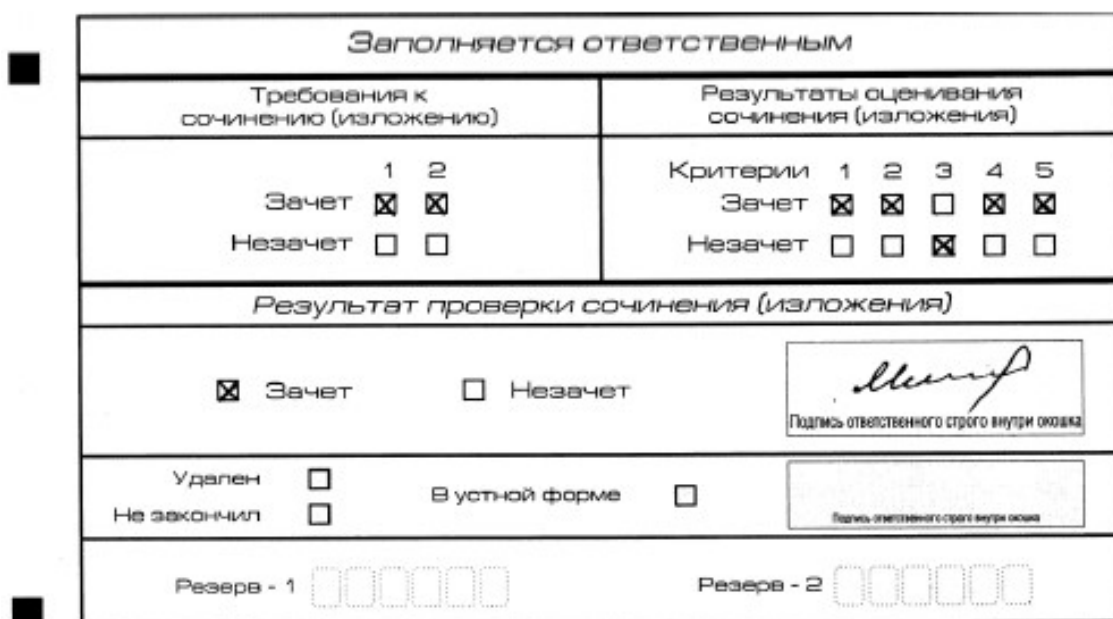
Рис. 3. Область для оценки работы

3. Во всех остальных случаях итоговое сочинение (изложение) проверяется по всем пяти критериям и оценивается по системе «зачет»/«незачет» (например, нельзя не проверять работу по критериям К4 и К5, если участник получил зачет на основании зачетов по критериям К1, К2, К3).