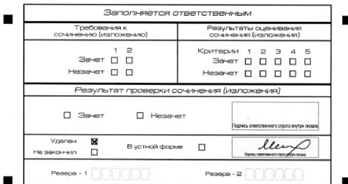
Рис. 6. Заполнение полей нижней части бланка регистрации (удаление с экзамена)

В случае если участник итогового сочинения (изложения) нарушил установленные требования, изложенные в п. 27 Порядка проведения ГИА, он удаляется с итогового сочинения (изложения). Член комиссии по проведению итогового сочинения (изложения) составляет «Акт об удалении участника итогового сочинения (изложения)» (форма ИС-09), вносит соответствующую отметку в форму ИС-05 «Ведомость проведения итогового сочинения (изложения) в учебном кабинете ОО (месте проведения)» (участник итогового сочинения (изложения) должен поставить свою подпись в указанной форме). В бланке регистрации указанного участника итогового сочинения (изложения) необходимо внести отметку «X» в поле «Удален». Внесение отметки в поле «Удален» подтверждается подписью члена комиссии по проведению итогового сочинения (изложения).